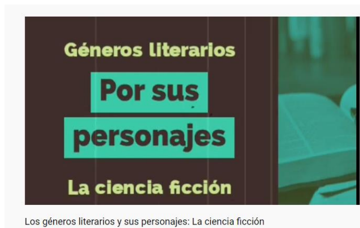
Los géneros literarios y sus personajes: La ciencia ficción

https://www.youtube.com/watch?v=H1SJPszp4lw&ab_channel=Contenidoeducativo