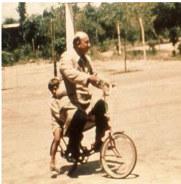
Un niño junto al Padre Obispo Enrique Angelelli

Enrique Angelelli fue el Padre Obispo de La Rioja desde 1968 hasta su asesinato en 1976